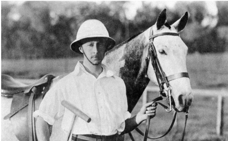
Onderste foto: Kroonprins Wilhelm van Pruisen tijdens een polowedstrijd in Brits-India in januari 1911.